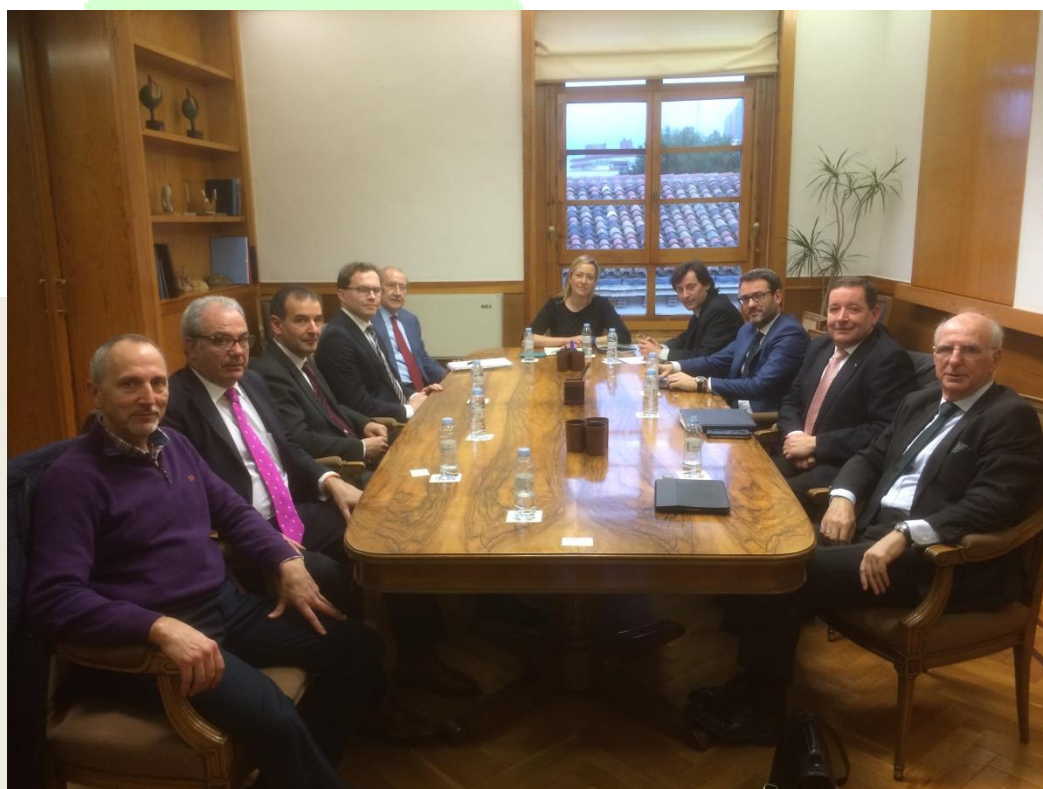
Unos instantes antes de comenzar la reunión