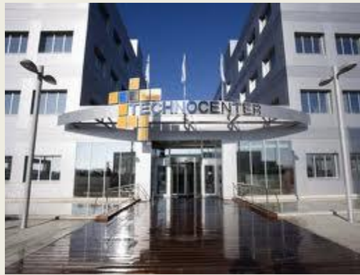
Vista de la Entrada del edificio "TECHNOCENTER"

Queremos aprovechar este Boletín para felicitar a todo el equipo humano por este feliz motivo, y desearles muchos años de gestión eficaz y éxitos empresariales.