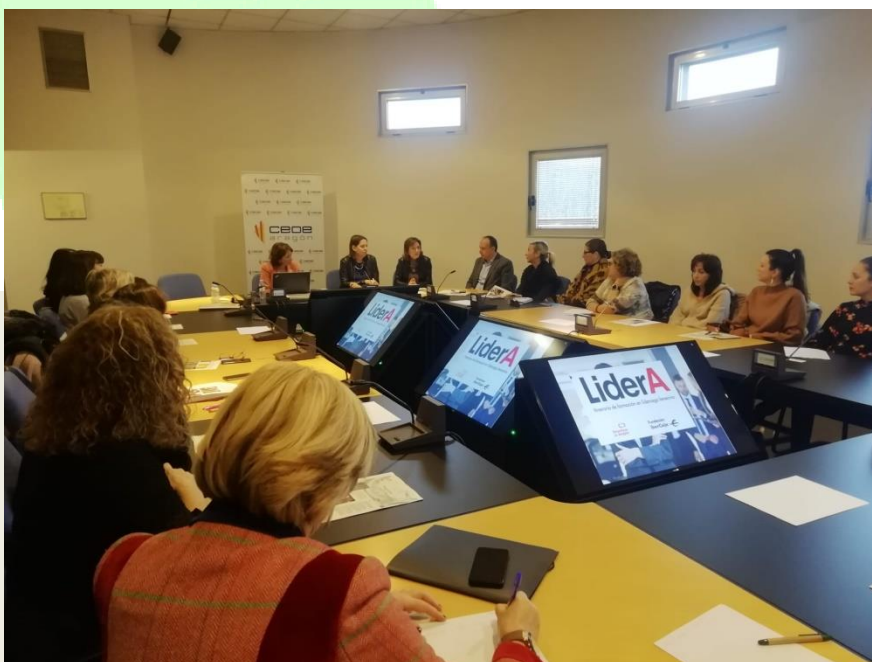
Un momento de la presentación