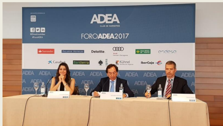
Mesa de presentación antes de la ponencia de la joven política

El pasado día 20 de Junio, organizado por ADEA, tuvo lugar en el Hotel Reina Petronila la charla de Dña. Inés Arrimadas portavoz de Ciudadanos en el parlamento de Cataluña. Al acto asistió el presidente de la asociación y varios asociados.