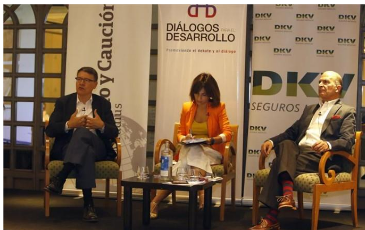
Los participantes durante un momento de su exposición

A este interesante acto asistió el presidente de AEPLA .