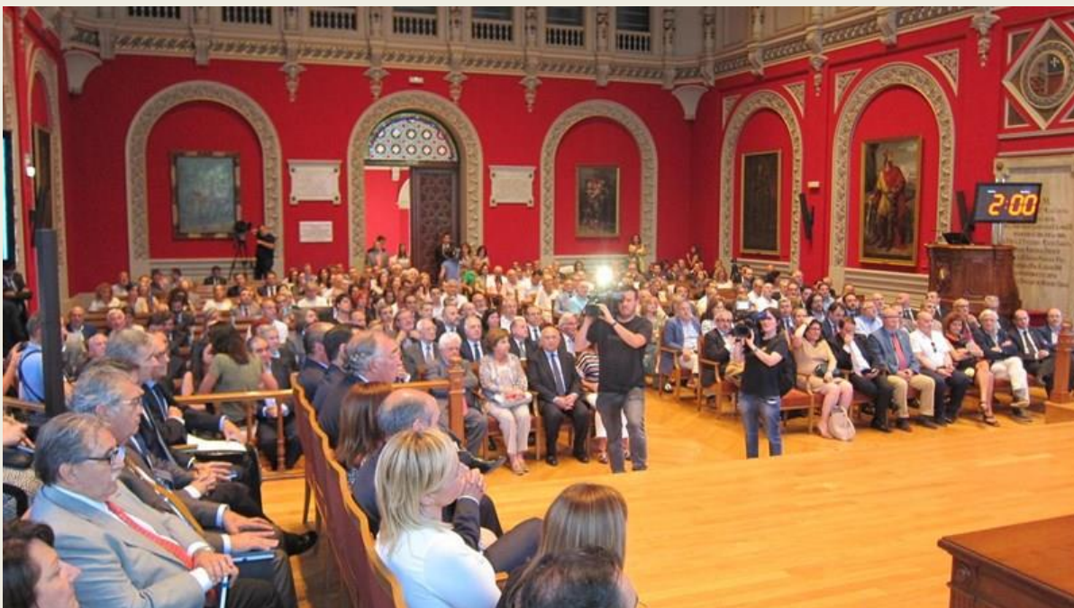
Aspecto del salón del Paraninfo, en nuestra ciudad.