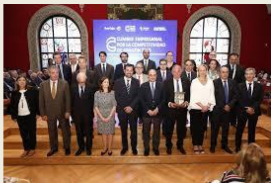
Foto de familia, tras finalizar el acto