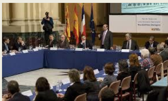
Momento de la presentación del Acuerdo