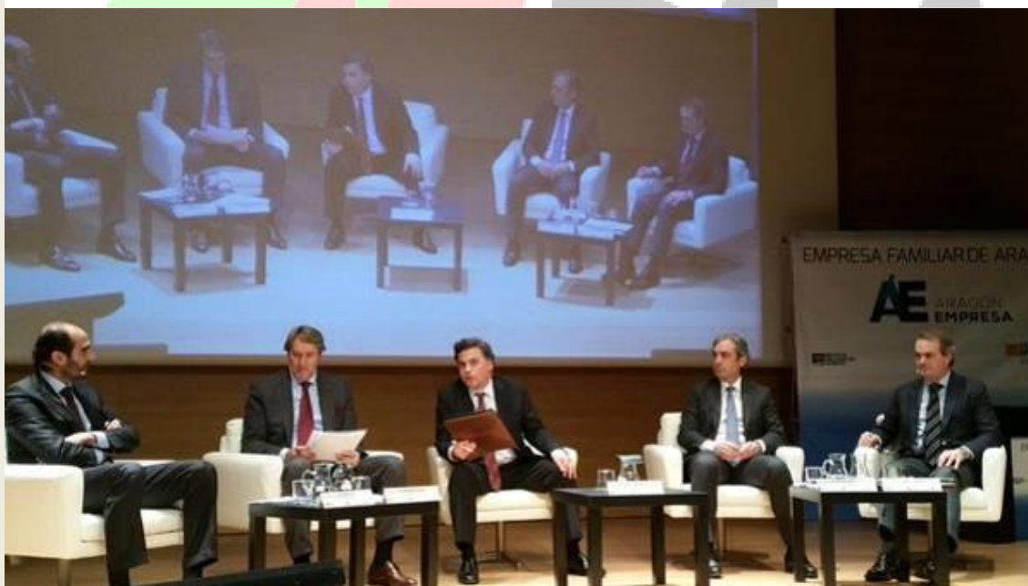
Un momento del debate durante la Jornada

Al acto asistió el Presidente de AEPLA junto a varios miembros de la Asociación.