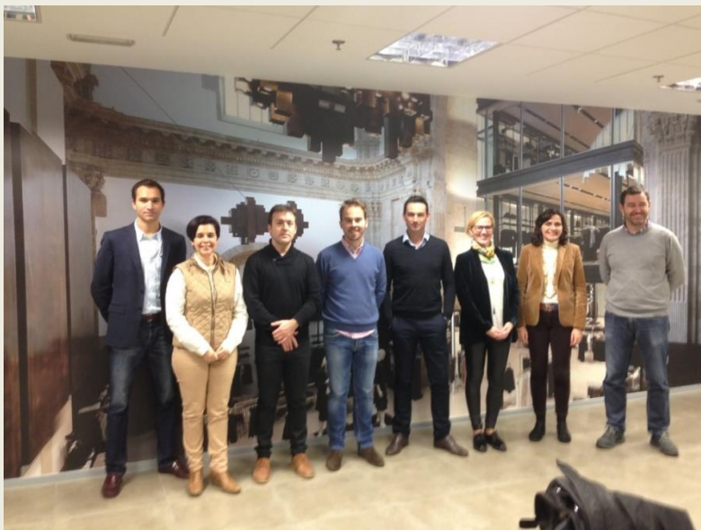
Parte de los visitantes a las instalaciones de BSH e INDITEX

Damos la Bienvenida al nuevo miembro de la Asociación: