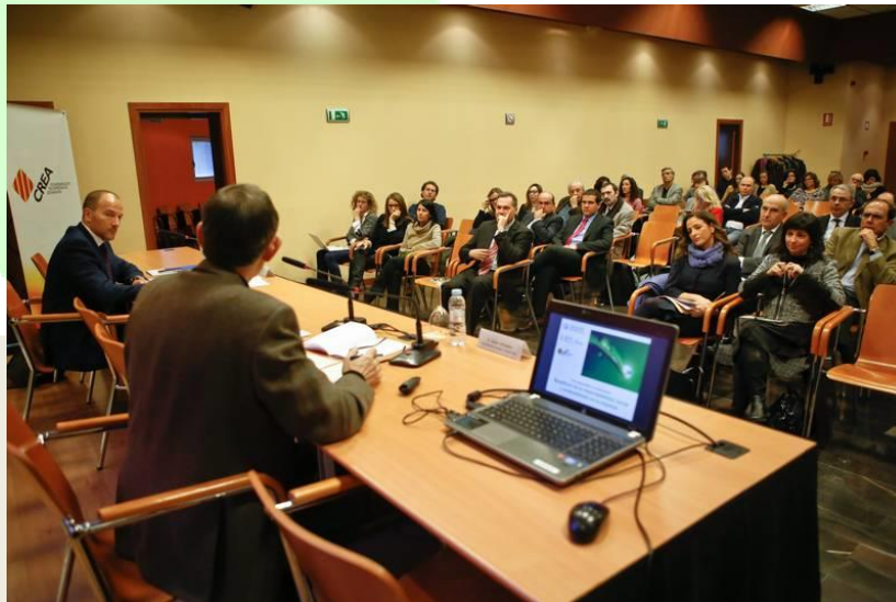
Momento de la intervención durante la presentación

A la Jornada asistieron varios miembros de AEPLA .