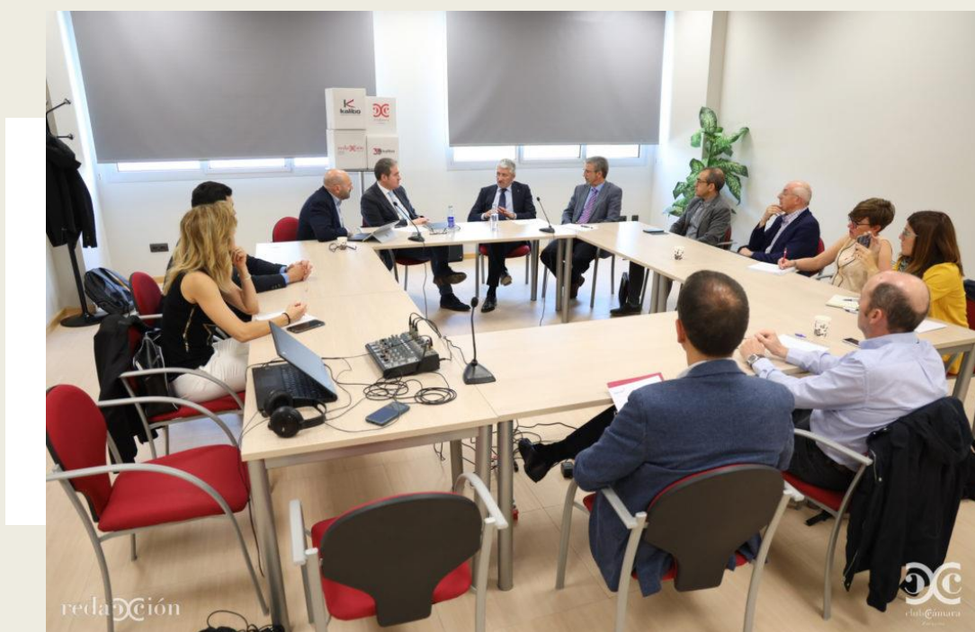
Momento de la Mesa abierta , desde la sede de AEPLA

A partir de 2015 crearon un proyecto con el objetivo de ser líderes en el año 2020 a nivel europeo en oferta de soluciones industriales, tanto en mantenimiento como en seguridad. La empresa sigue incorporando nuevas compañías y líneas de producto, por lo que la proyección para los próximos años se prevé muy buena.